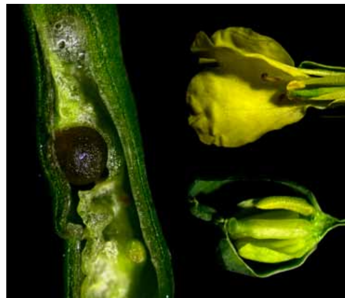
Izquierda: semilla en formación dentro de su vaina; Derecha arriba: flor; Derecha abajo: vista interior del botón