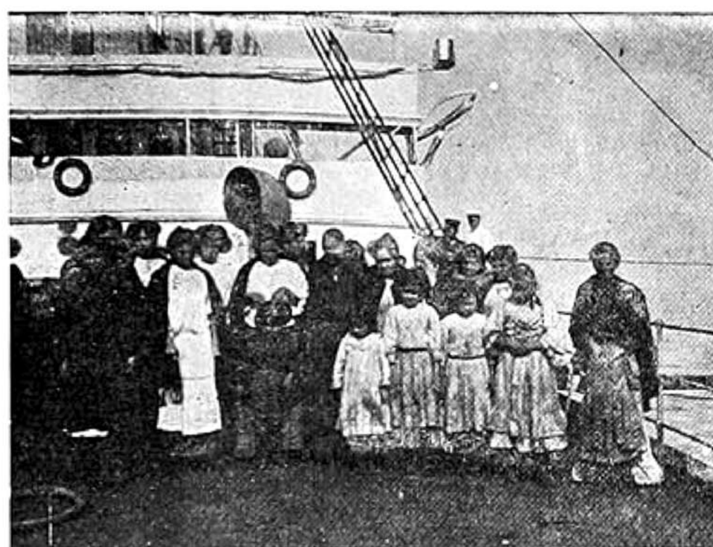
Otro grupo de familia que acompañan á los reos.