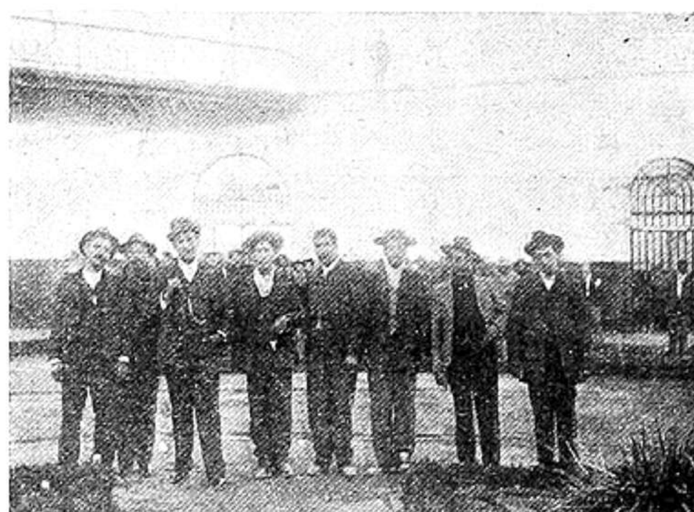
GRUPOS DE REOS QUE VAN DESTINADOS Á LA COLONIA PENAL DE JUAN FERNÁNDEZ.